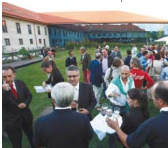
Acto de presentación de la mejora del campo.