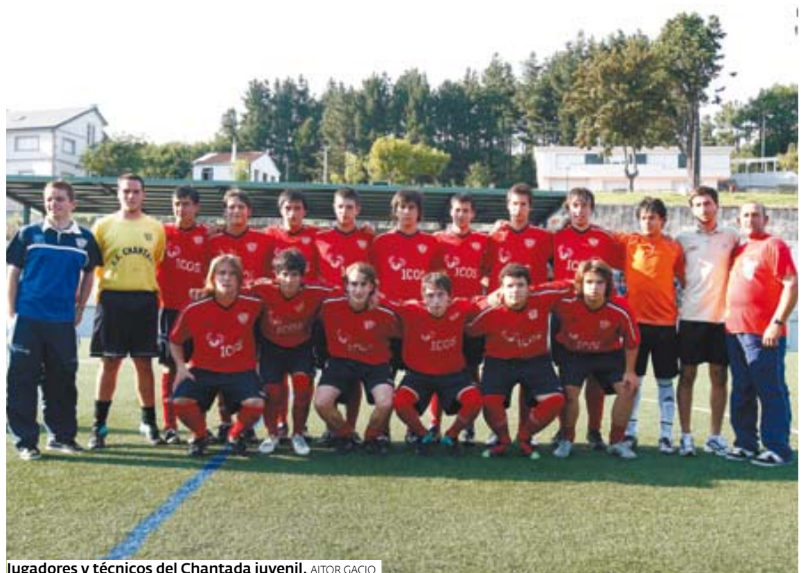
Jugadores y técnicos del Chantada juvenil. AITOR GACIO

En la Liga Gallega infantil, los de Michel juegan mañana en la ciudad del Lerez ante un Pontevedra que también parte como favorito. La jornada para los cuatro equipos vuelve a presentarse complicada.