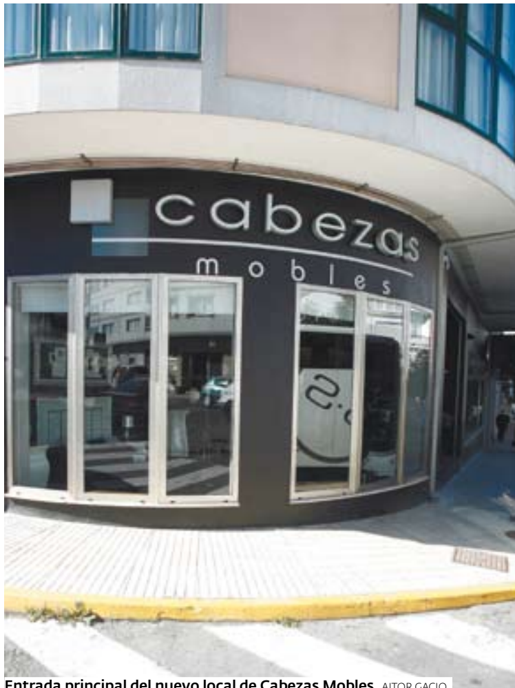
Entrada principal del nuevo local de Cabezas Mobles.

Cabezas Mobles amplió su panel de servicios al mismo tiempo que construyó unas instalaciones