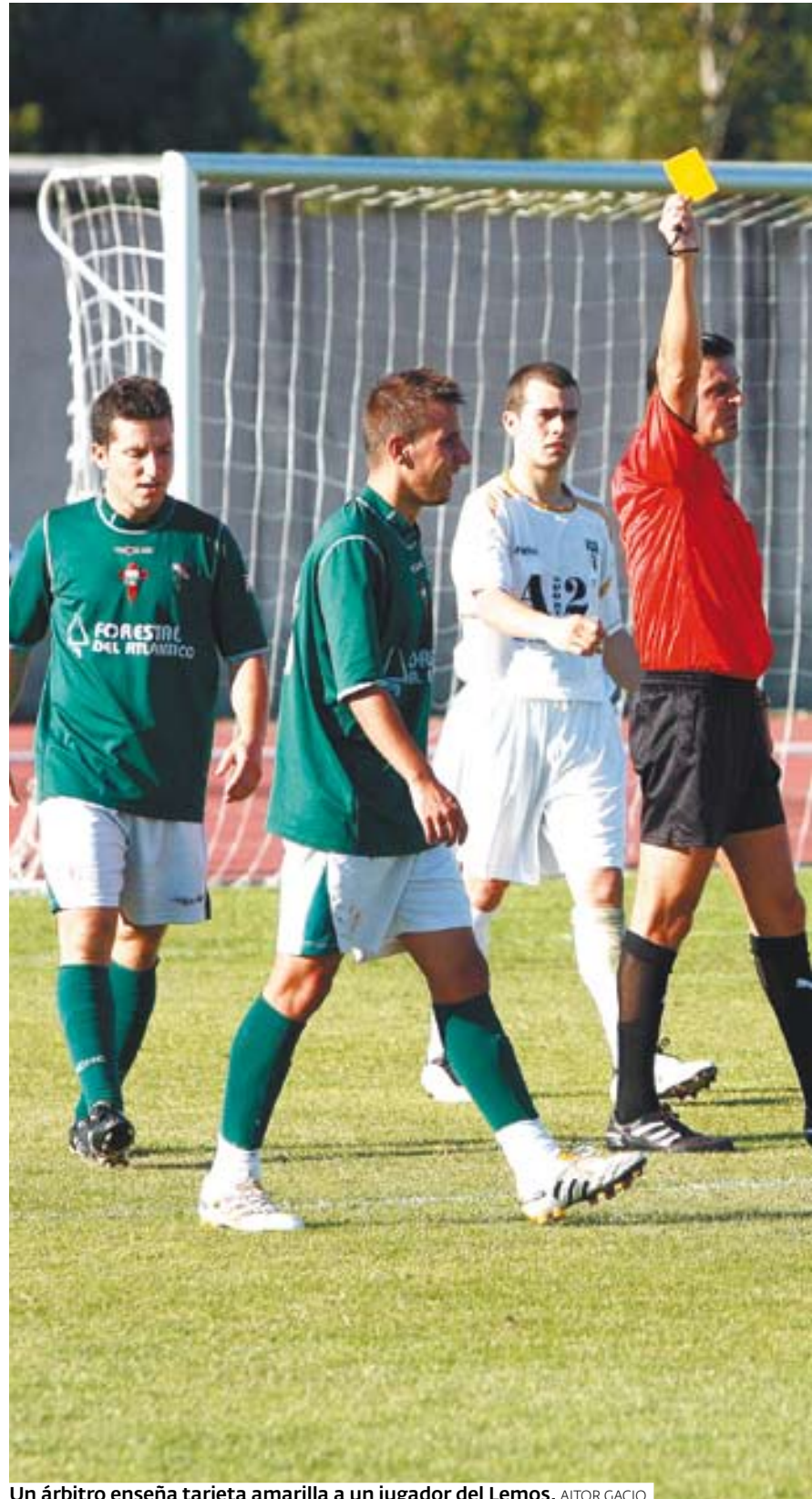
Un árbitro enseña tarjeta amarilla a un jugador del Lemos.

Tanto el Ferreira, ante el Cabreiros, y el Bóveda, en O Valadouro, se presentan como claros favoritos para lograr la victoria.