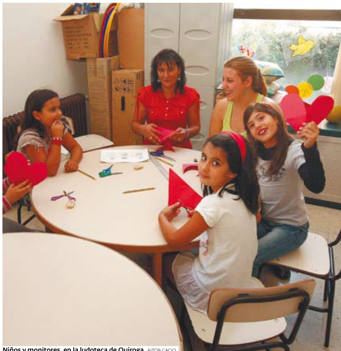
Niños y monitoras, en la ludoteca de Quiroga. AITOR GACIO

Al salir los más pequeños, que tienen de tres a cuatro añitos, le llega el turno a los de siete a nueve años. Un grupo de niñas entra en la habitación y se pone rápida-