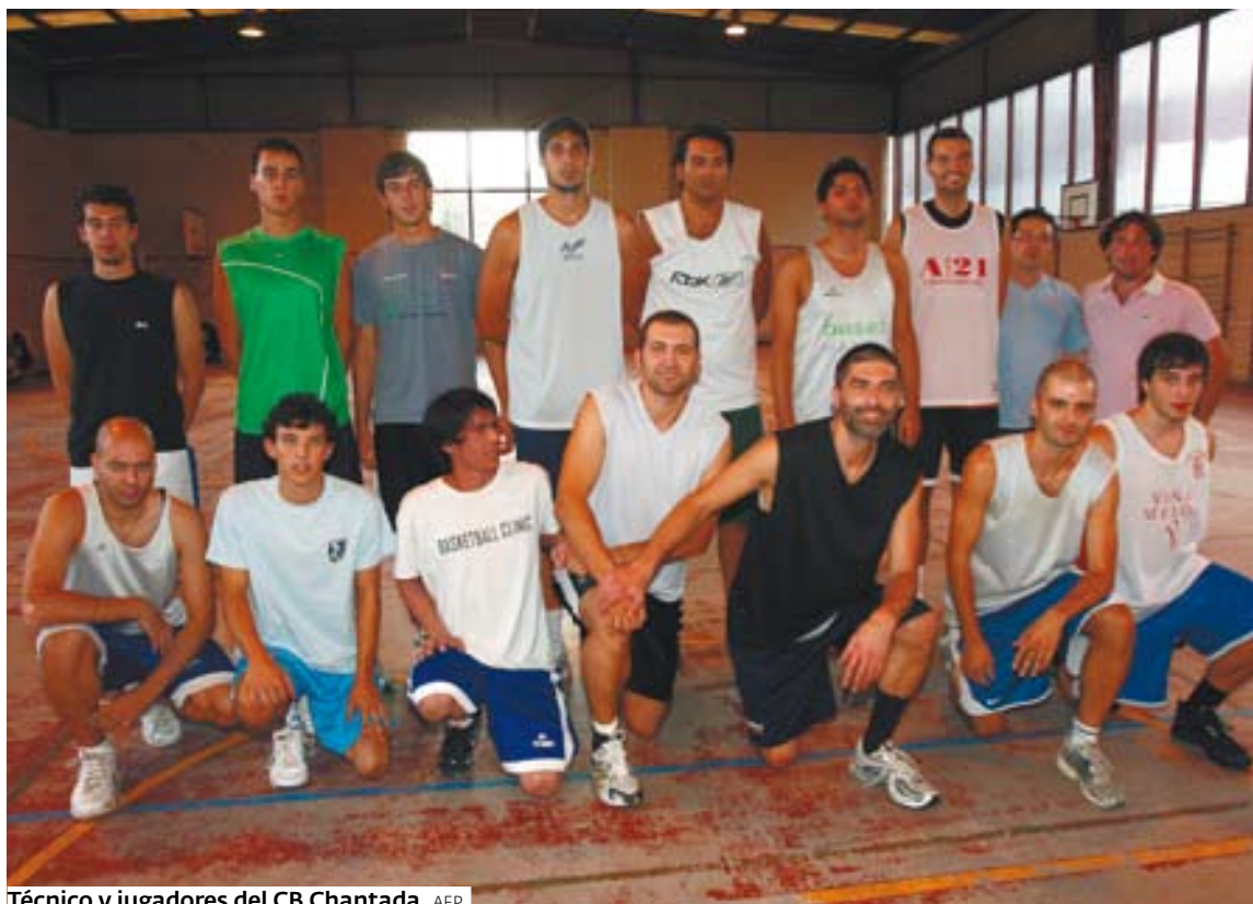
Técnico y jugadores del CB Chantada.