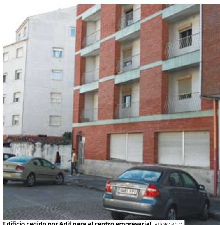
Edificio cedido por Adif para el centro empresarial. AITOR GACIO