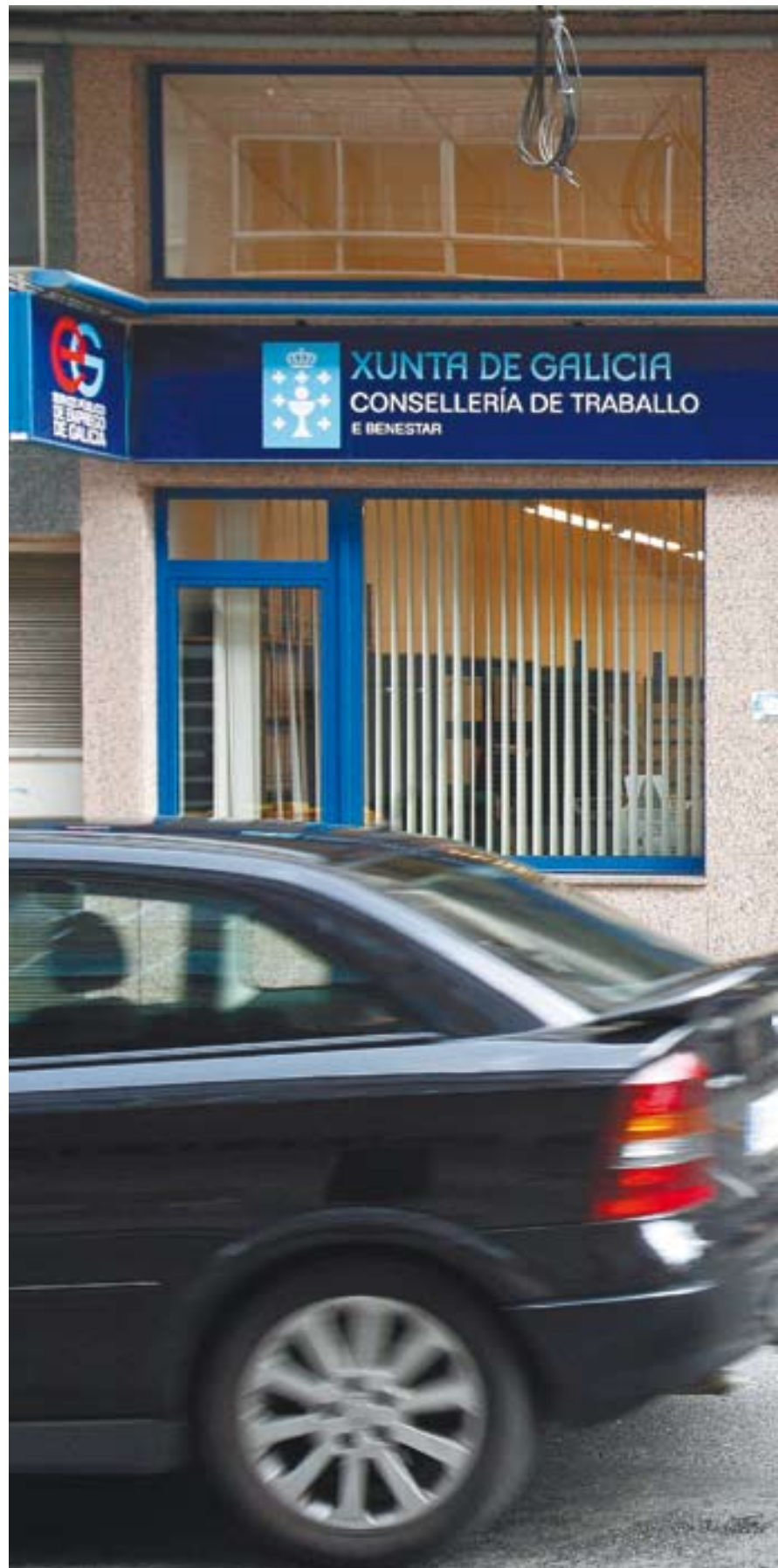
Dos mujeres salen de la oficina de empleo situada en la Rúa San Pedro de Monforte.

Los ayuntamientos con mayor incremento de paro femenino fueron, por este orden, Carballedo y Taboada, en ambos casos unidos al sector agroganadero. En el lado opuesto se sitúa A Pobra do Brollón y Sober, donde el desempleo entre las mujeres disminuyó.