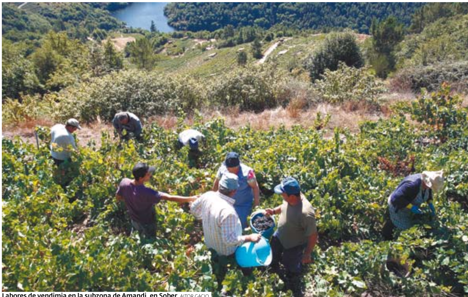
Labores de vendimia en la subzona de Amandi, en Sober. AITOR GACIO