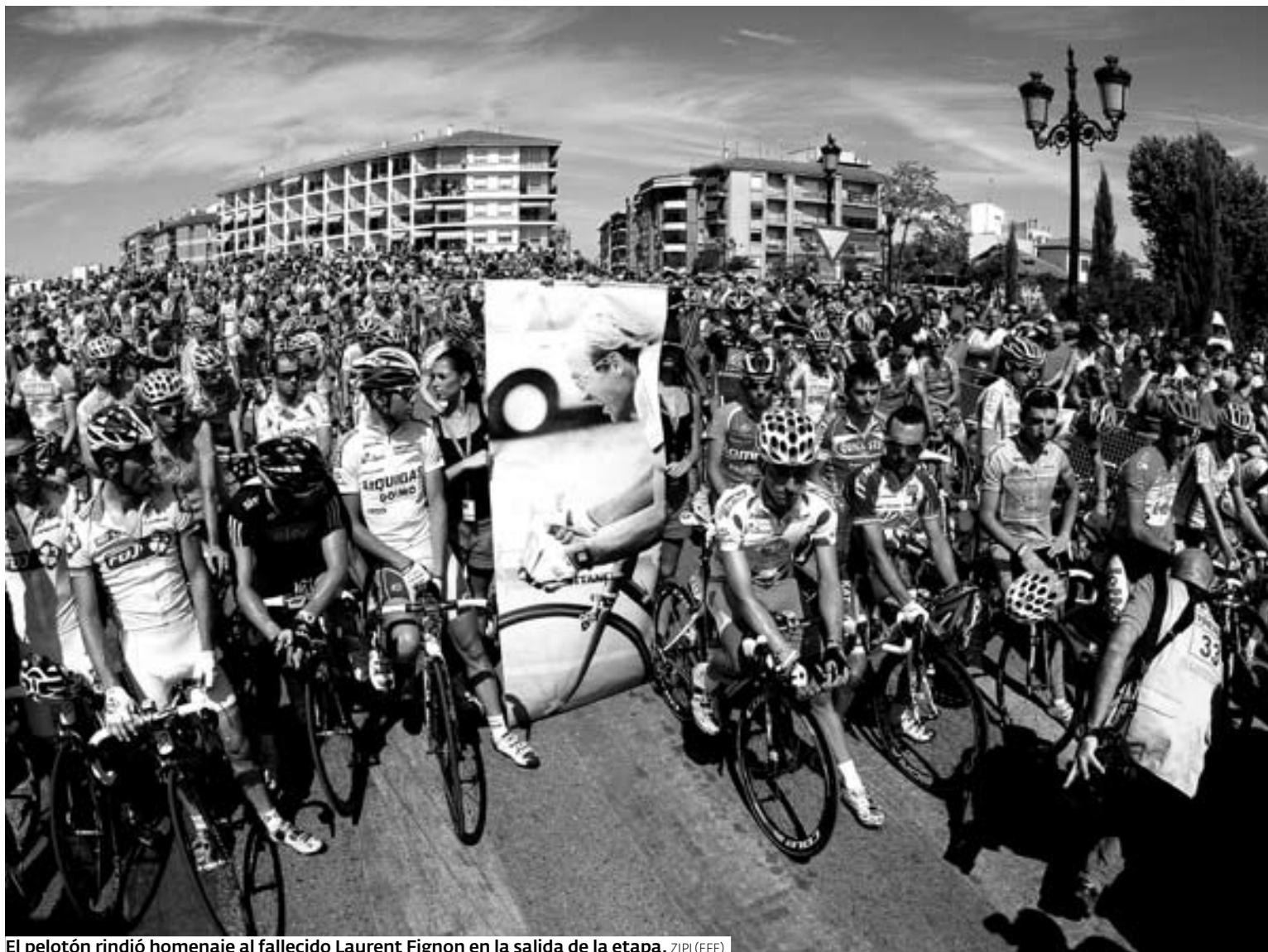
El pelotón rindió homenaje al fallecido Laurent Fignon en la salida de la etapa.