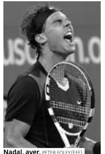
Nadal, ayer.