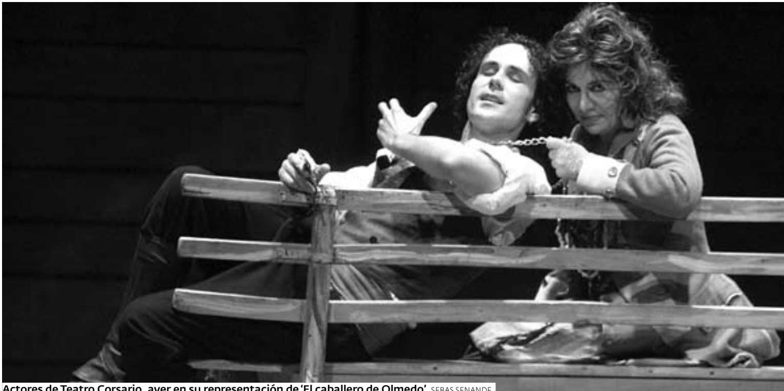
Actores de Teatro Corsario, ayer en su representación de 'El caballero de Olmedo'. SEBAS SENANDE