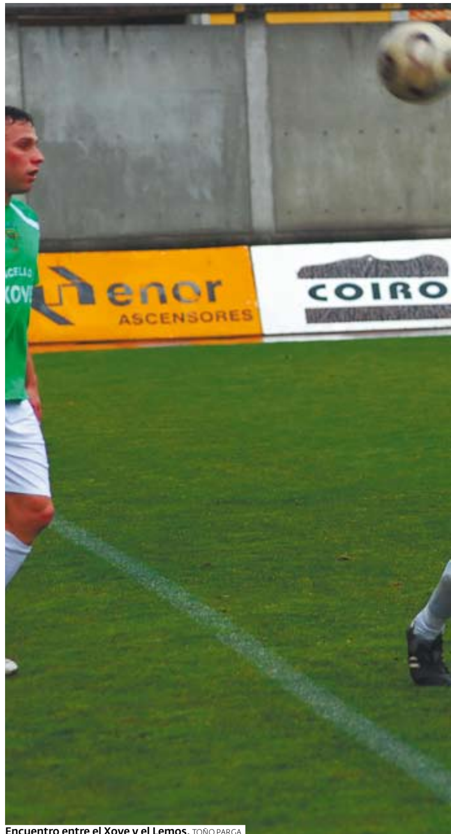
Encuentro entre el Xove y el Lemos. TOÑO PARGA

El Ferreira, que es favorito en Muimenta, sólo fue capaz de sumar un punto en O Balaño ante el líder Páramo. Lo peor de la jornada lo protagonizó el Bóveda con una derrota por la mínima en el campo del Riotorto, un rival directo para intentar llegar a las dos plazas que dan derecho al ascenso. Más asequible se presenta el partido en Cabreiros, disputando dos encuentros consecutivos fuera de casa.