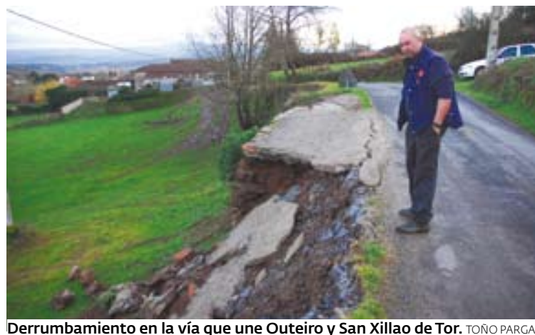
Derrumbamiento en la vía que une Outeiro y San Xillao de Tor. TONO PARGA

Los residentes en el pueblo consideran que el problema es que en