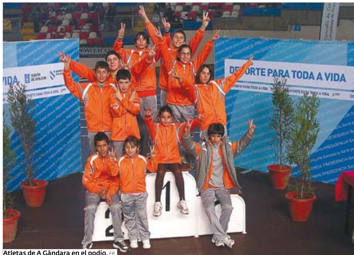
Atletas de A Gándara en el podio.