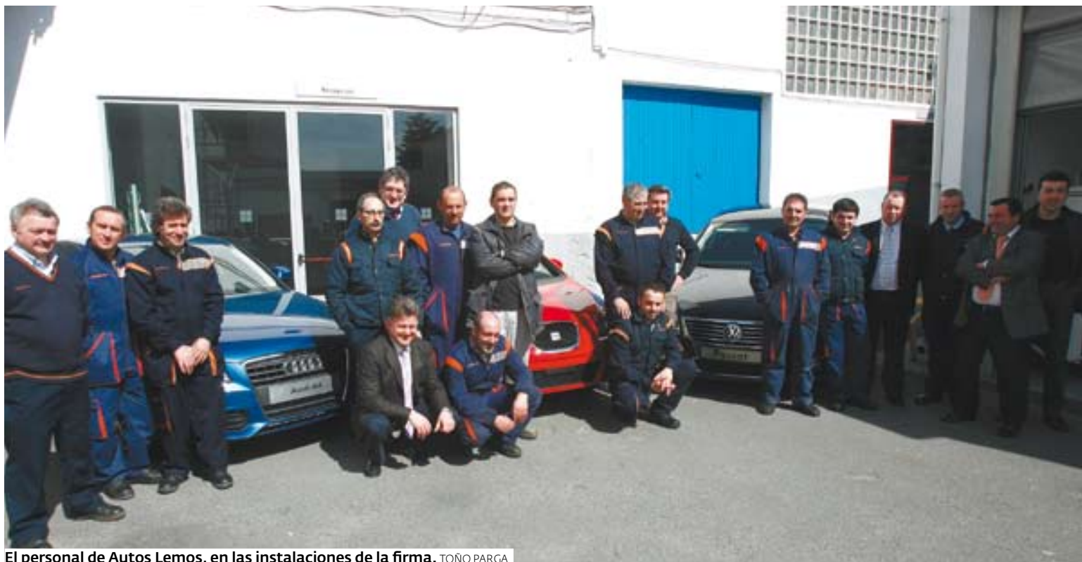
El personal de Autos Lemos, en las instalaciones de la firma. TOÑO PARÇA

El grupo Autos Lemos nació en la ciudad del Cabe en el año 1979 y en la actualidad lleva las marcas Ford, Fiat, Alfa y Lancia. Su volumen de ventas está en unos 350 coches nuevos al año y unos 250 usados. Con el nuevo servicio oficial de Volkswagen a través de Monforte Motor, el grupo prevé aumentar su actividad cerca de un 40%. Para ello preparó una nueva zona de exposición a la que ya comenzaron a llegar los primeros vehículos y están a disposición de