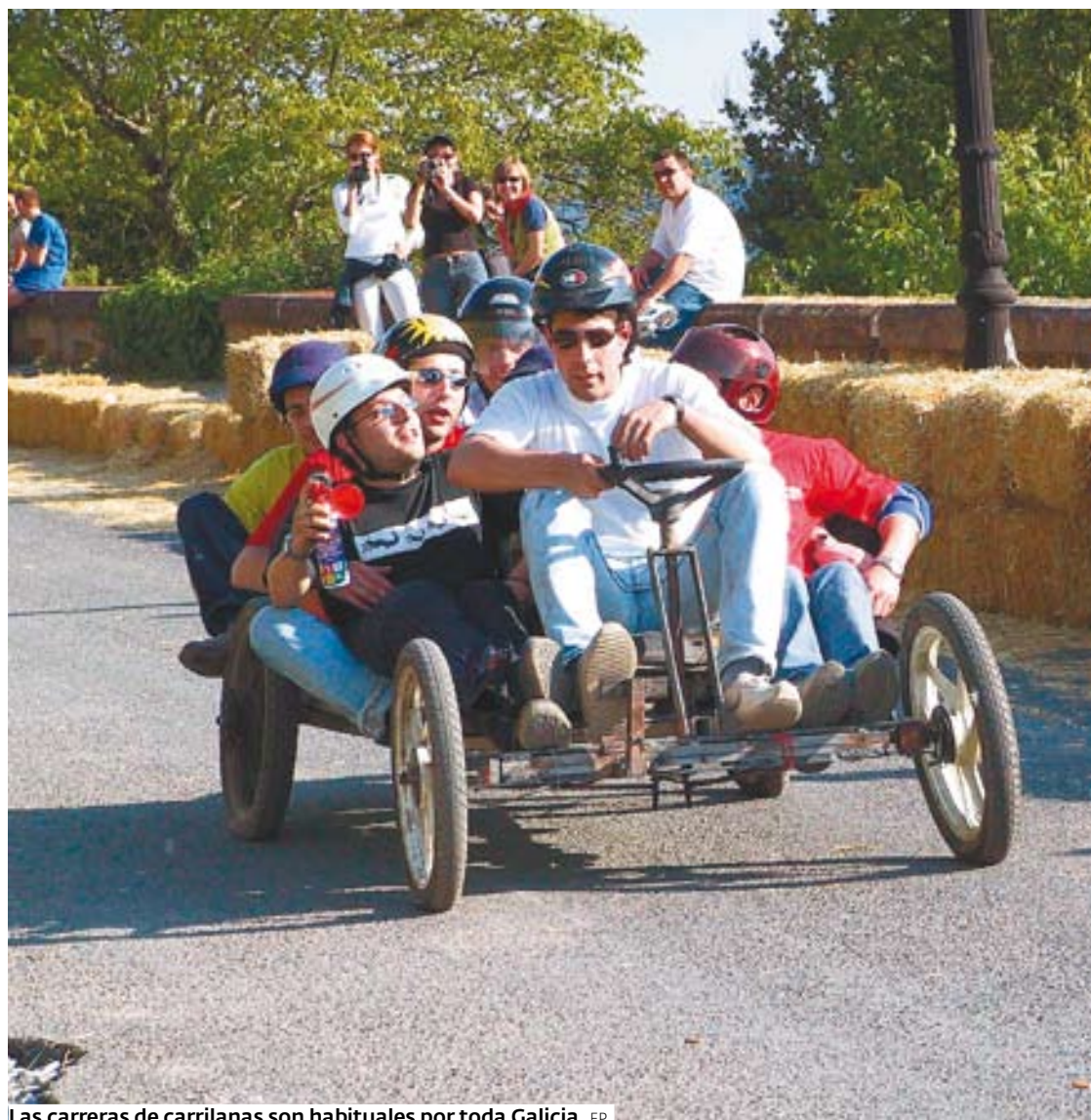
Las carreras de carrilanas son habituales por toda Galicia.

caras los vehículos con chasis y hierro, en un segundo apartado competirán los bikers en los que se incluyen todo tipo de bicicletas y patinetes que destacan por el espectáculo que ofrecen.