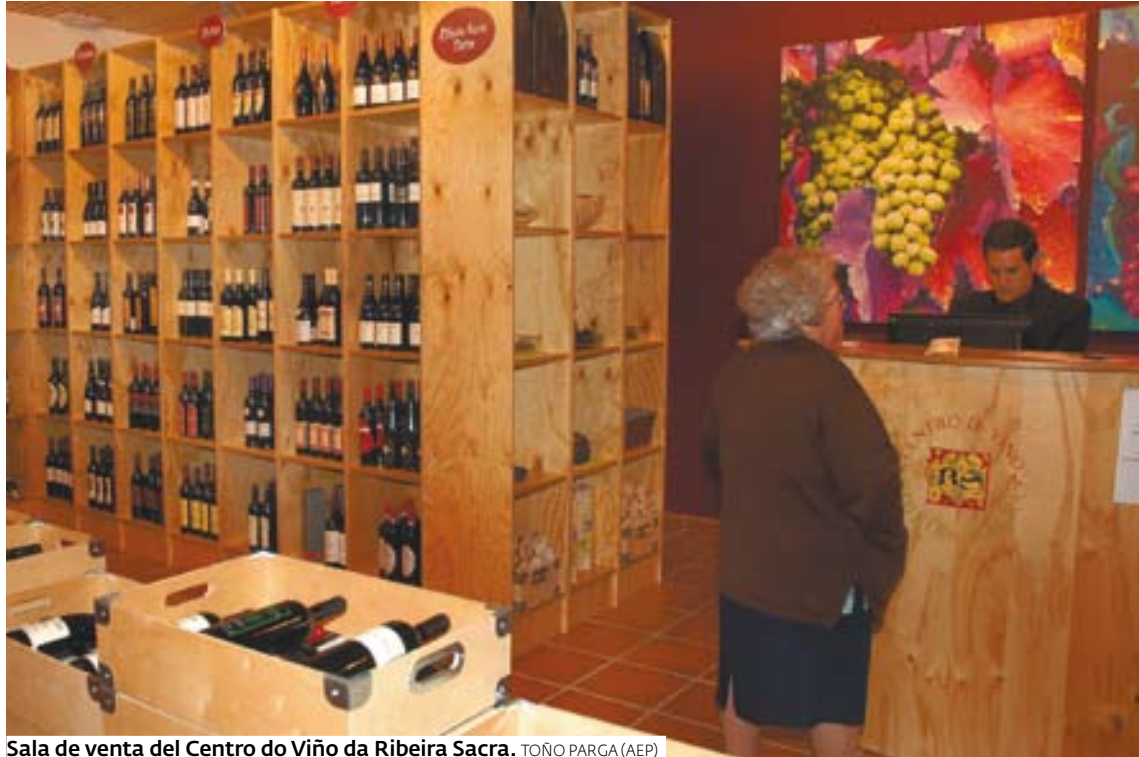
Sala de venta del Centro do Viño da Ribeira Sacra.

CON LAS BODEGAS. Al mismo tiempo que abre el camino de la promoción en el exterior, el Centro do Viño comenzó ayer una serie de visitas a las bodegas de Ribeira Sacra con diversas finalidades. La principal será estrechar la unión con los productores y ver las posibilidades de emprender