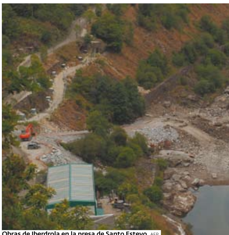
Obras de Iberdrola en la presa de Santo Estevo.