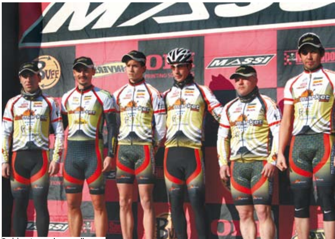
Participantes en el open gallego.