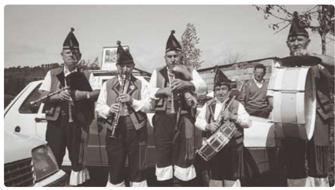
Año 1993 ▶ Actuación del grupo de gaiteros Os Silvas de Monforte

«En Monforte hacen falta muchas obras del plan E porque hay muchas carencias. Lo que hicieron hasta ahora está bien pero deberían preocuparse de forma igualitaria por todas las calles de la ciudad. Por ejemplo, es necesario reparar la zona de A Corredoira y actuar en otras calles en las que cuando llueve se forman charcos enormes. A veces da la sensación de que hay zonas más privilegiadas que otras y se debería pensar en la ciudad en conjunto».