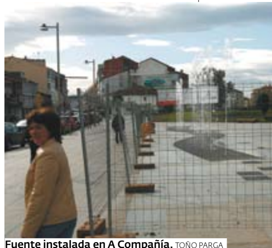
Fuente instalada en A Compañía.

En total, la Xunta de Galicia, a través de la Consellería de Vivenda