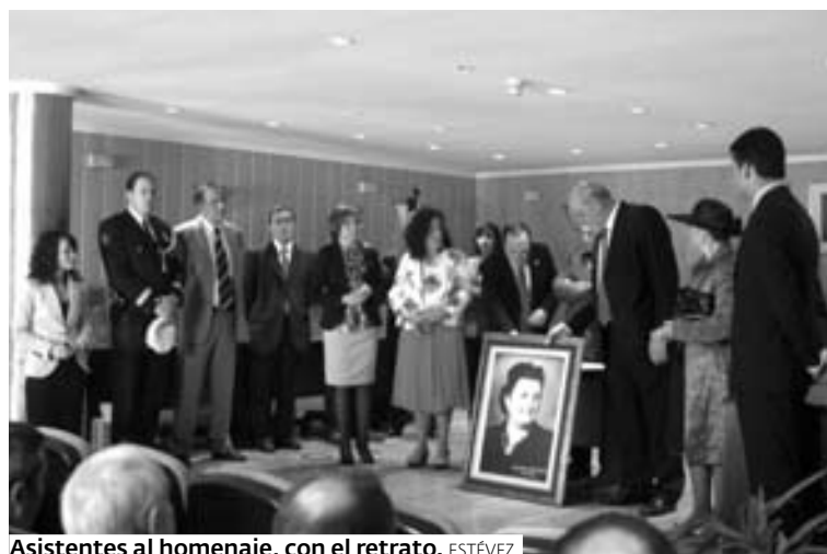
Asistentes al homenaje, con el retrato. ESTÉVEZ

como emigrante durante 47 años en Argentina —a donde se fue con 16—, sus 14 años en Barcelona y su vinculación con Sarria. Simpática y entrañable (sigue calzando tacones) recibió varios presentes del alcalde de Paradela, José Manuel Mato. ESTÉVEZ