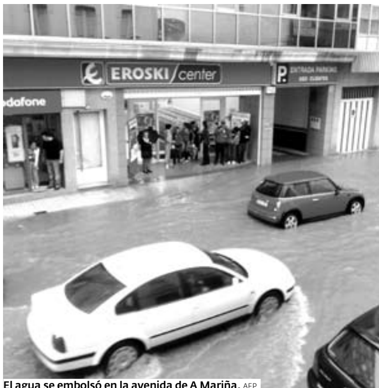
El agua se embolsó en la avenida de A Mariña.

El regidor focense aseguró que en sus trece años en el cargo se ejecutaron importantes obras de infraestructuras básicas. «Collimos un concello no que o 40% dos cida-