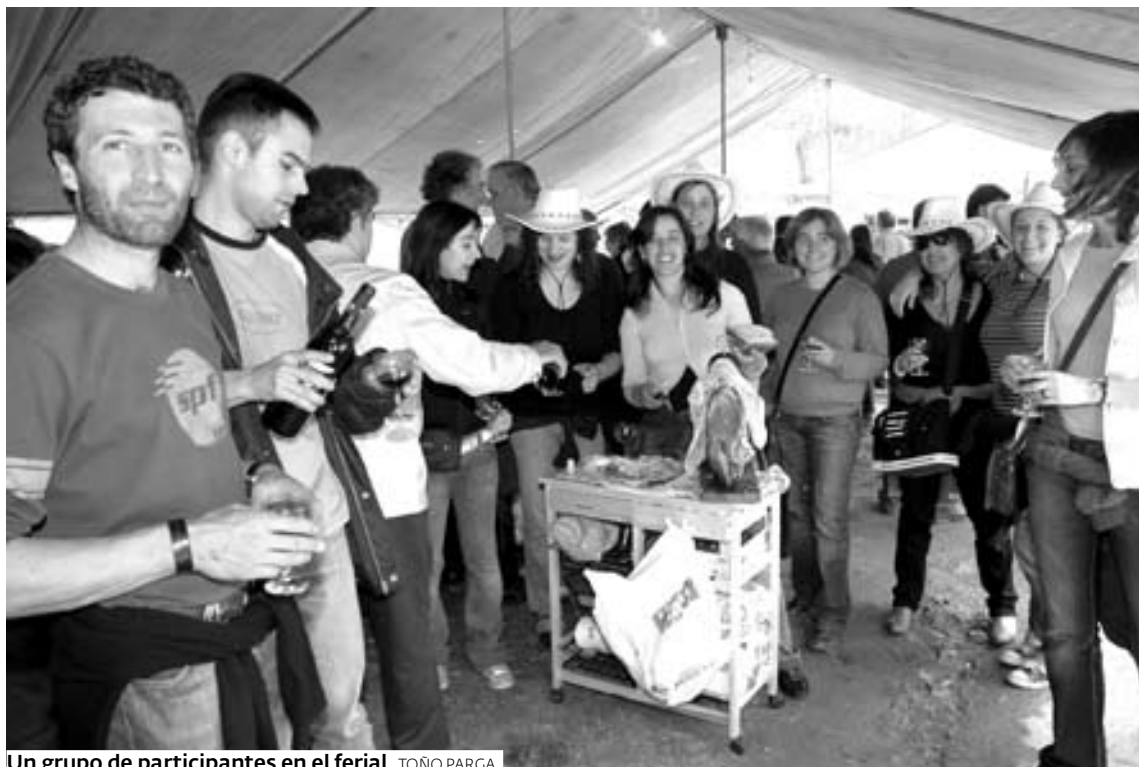
Un grupo de participantes en el ferrial. TONO PARGA

El buen tiempo reinante a lo largo de toda la jornada de ayer animó a cientos de vecinos de la zona sur de la provincia a acercarse hasta el ferrial de Belesar y probar los excelentes vinos que se cosechan en este territorio que forma parte de la denominación de origen Ribeira Sacra. Cinco bodegas, de las que cuatro están amparadas por el consejo regulador, pusieron a la venta en torno a los 5.000 litros. Todos destacaron las buenas ven-