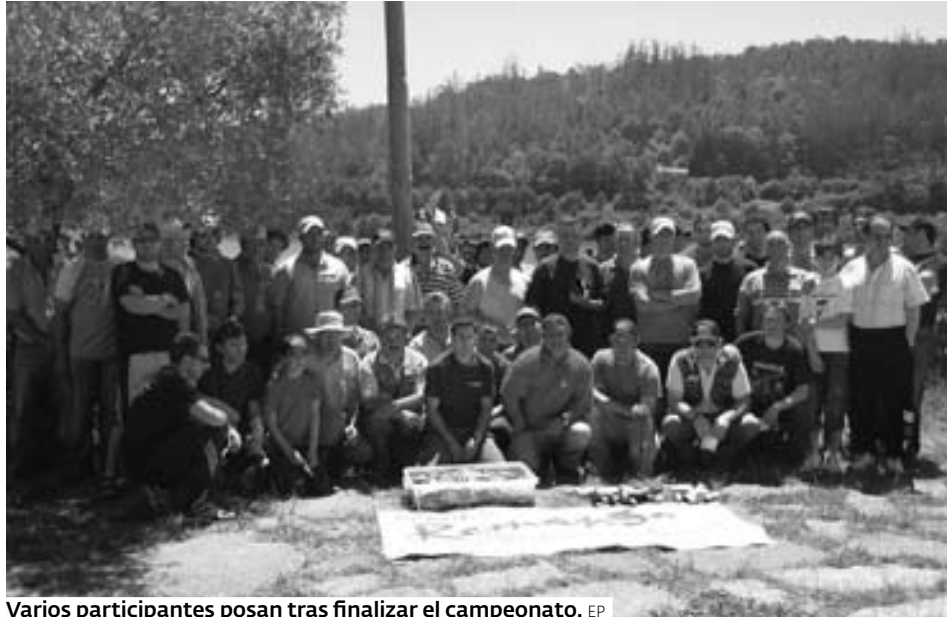
Varios participantes posan tras finalizar el campeonato.

La localidad alicantina de Denia acogerá del 2 al 4 de julio el X Campeonato de España Open de Pesca de Altura al Curricán, en el que se darán cita unas cuarenta embarcaciones.