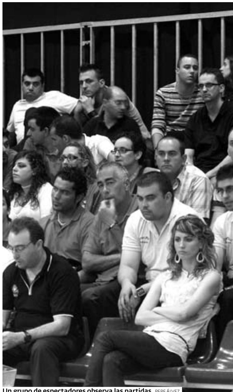
Un grupo de espectadores observa las partidas. PEPE ALVEZ

CONTINUACIÓN. Tras el éxito del primer fin de semana, los tacos y las bolas no descansan durante las próximas jornadas. Serán siete días repletos de concentración y buen juego durante los que llegarán a Lugo los mejores jugadores de España para la disputa de los Nacionales. La olla a presión de nervios y tensión no bajará, pues, su intensidad.