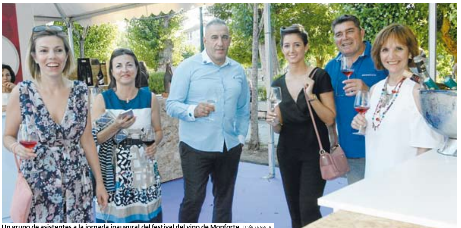
Un grupo de asistentes a la jornada inaugural del festival del vino de Monforte. TOÑO PARGA